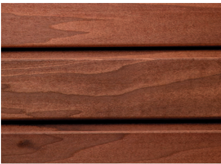
Thermo-Espe: wärmebehandelt, pflegeleicht

Für die „Designsauna“ verwenden wir ausschließlich dieses Holz, das durch seine gleichmäßige Färbung begeistert und eine frische, attraktive Atmosphäre schafft. Dank geringer Wärmeleitfähigkeit sehr angenehm für die Haut.