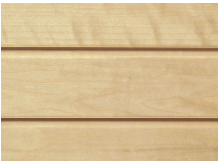
Espe: hell, edles und einzigartiges Aussehen

Bedenken Sie bitte, dass Farbabweichungen durch Foto und Druck nicht zu vermeiden sind. Fragen Sie deshalb Ihren Saunaexperten nach Originalmustern.